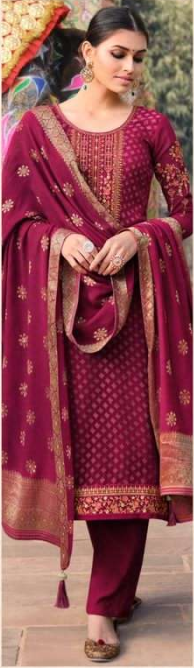
• 891 •