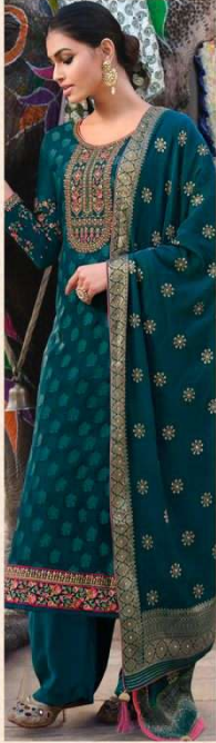
• 892 •