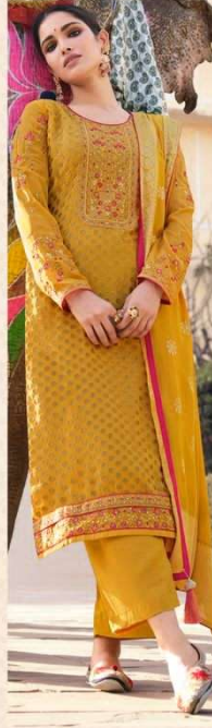
• 893 •