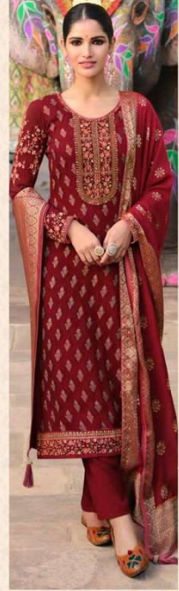
• 895 •