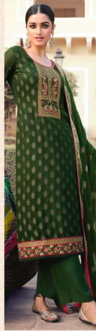
• 894 •